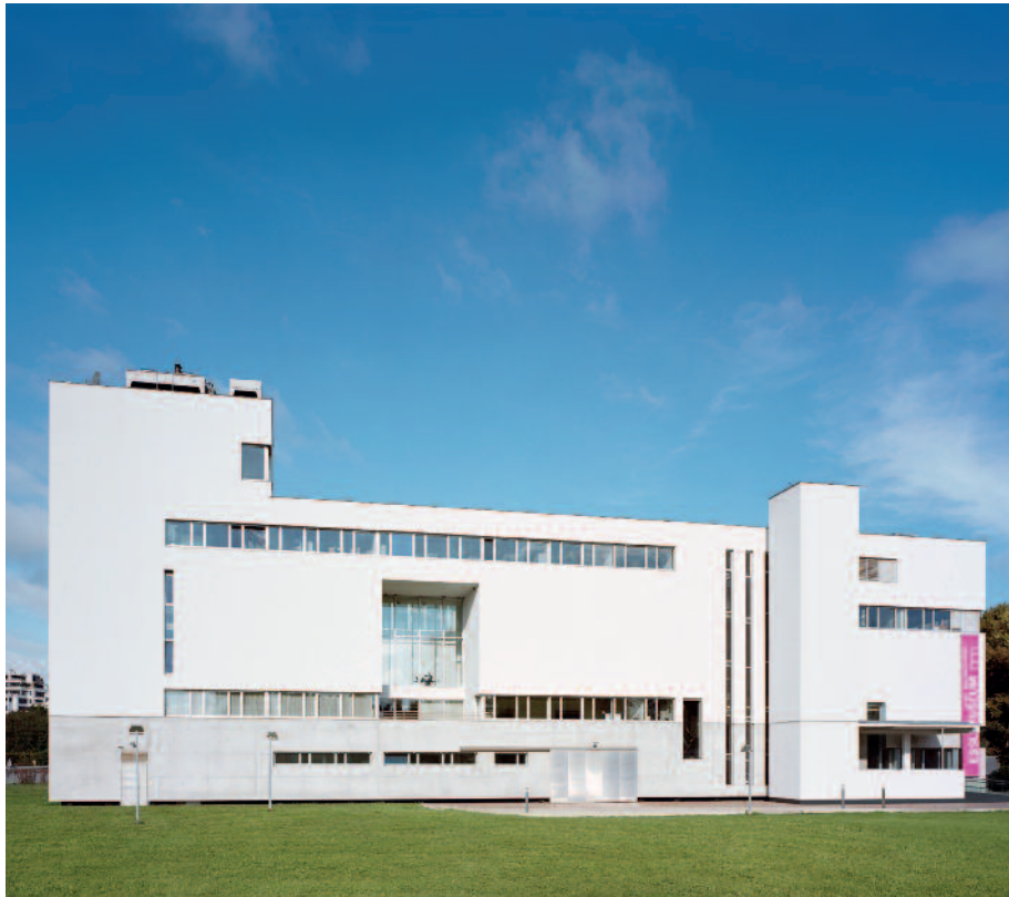
Essl Museum Außenansicht, 2014

Strukturen, sondern es wurde schnell und flexibel agiert. Was die innovative Vermittlung angeht, so war auch hier das Besondere, dass das Sammlerehepaar sehr von der angloamerikanischen Museumskultur geprägt war, eine starke Vermittlungsarbeit dezidiert wollte und dem Team große Freiheit gelassen hat. So konnten auch budgetär aufwändige partizipatorische Projekte verwirklicht und Angebote für sozial schwache Gruppen entwickelt werden, die keine Einnahmen brachten.