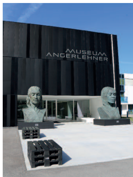
Außenansicht Museum Angerlehner