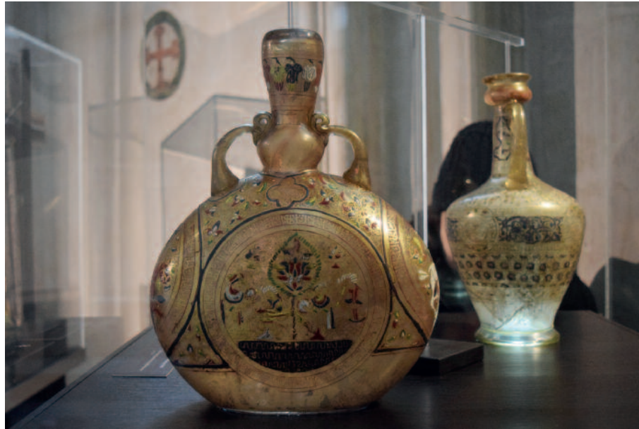
Glasgefäß aus Syrien mit Emaildekor, 13.-14. Jh., Dom Museum Wien

Nun sei gesagt, dass eines dieser Glasgefäße der „Islamischen Kunst“ profane Bildinhalte zeigt – eine Szene mit Musikern und