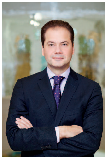
Max Hollein

ist dann noch einmal etwas ganz anderes, denn der Museumsbesuch kann etwas, was der Museumsbesuch im Netz in dieser Form derzeit noch nicht kann: Er bietet dieses ganzheitliche Erlebnis, man sieht ja nicht nur das Objekt vor sich, sondern es gibt auch den Weg zum Objekt, all das, was man rundum noch wahrnimmt, spielt natürlich eine Rolle und diese berühmte Aura des Objekts, die hat schon ihre Kraft. Man darf auch nicht vergessen, dass es ja nicht mehr nur das eine Publikum gibt, mit der einen Erwartungshaltung, die Publika werden immer differenzierter.