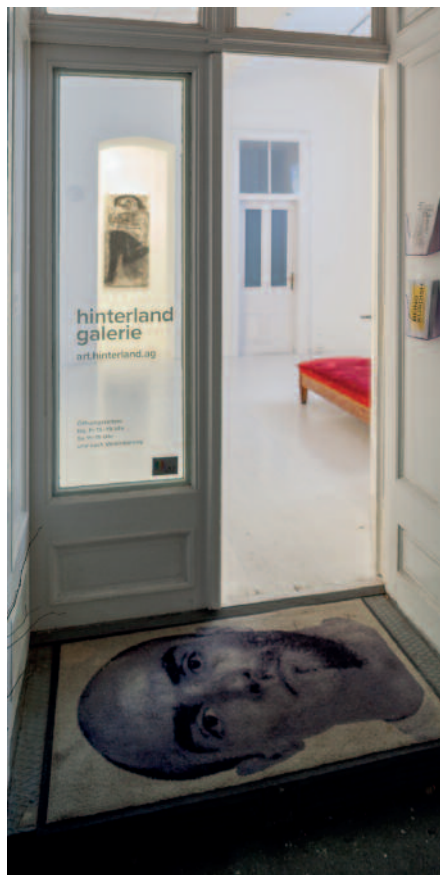
Ausstellungseinblick Being Kurdish hinterland galerie, Wien, Foto: Jakob Winkler