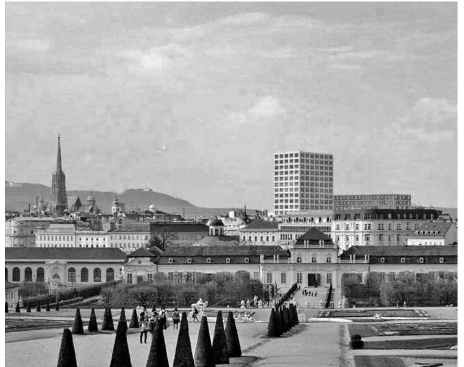
Blick vom Belvedere 2020?, Quelle: Stadt Wien, MA 41, Stadtvermessung

Für die Betreiber lohnt sich der Aufwand jedenfalls. Ihren Beteuerungen, an diesem Projekt kaum zu verdienen, lässt sich eine einfache Rechnung entgegenhalten. Ein Durchschnittspreis von 12.000,- Euro pro Quadratmeter Wohnfläche ist realistisch angesichts einer Lage, die in den obersten Geschoßen reihum Blick auf die Stephanskirche, den Stadtpark, das Belvedere und die Karlskirche bietet und damit nicht mit Dachböden im ersten Bezirk, sondern mit Top-Lagen in New York und London konkurriert. Bei Baukosten von geschätzten 2.000,- Euro pro Quadratmeter, 500 m 2 Wohnfläche und 18 Geschoßen bliebe eine Differenz von 90 Millionen Euro, von der rund 20 Millionen für Straßenverlegung, Grundstückskosten, Projektentwicklung und für die „Geschenke“ an