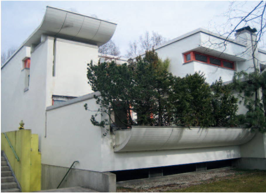
Ottobrunn, Terrassenwohnanlage an der Unterhachinger Straße, errichtet 1970-73 nach Entwurf von Herbert Kochta

Im Rahmen der Inventarisierung an den deutschen Landesdenkmälern ist die Erfassung der jüngeren, nach 1960 entstandenen Architektur ein wichtiger Arbeitsschwerpunkt innerhalb der letzten Jahre. Es gilt aus der Fülle des Bauens in der Zeit nach 1960 diejenigen Objekte auszuwählen, die als Denkmäler erfasst werden und damit – möglichst dauerhaft – erhalten werden sollen.